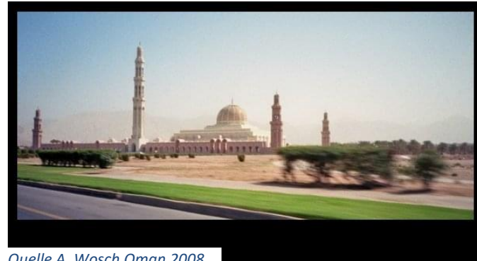
Oman 2008